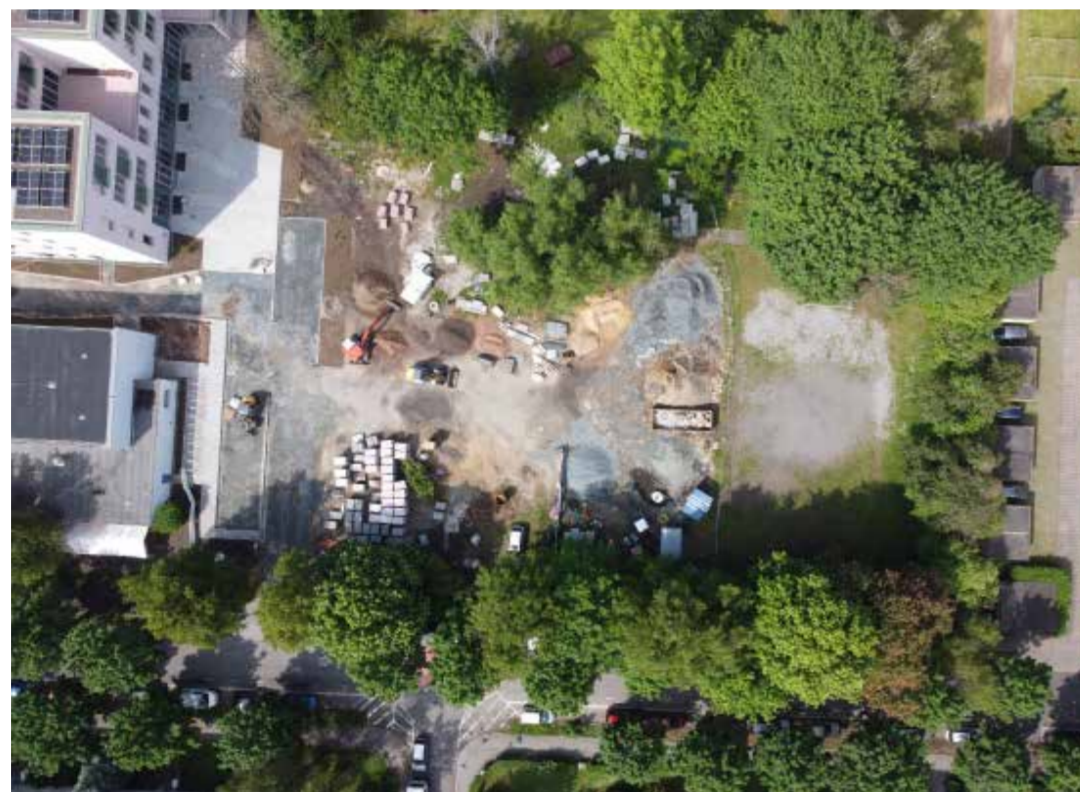
Aktuelles Bild des Sportplatzes