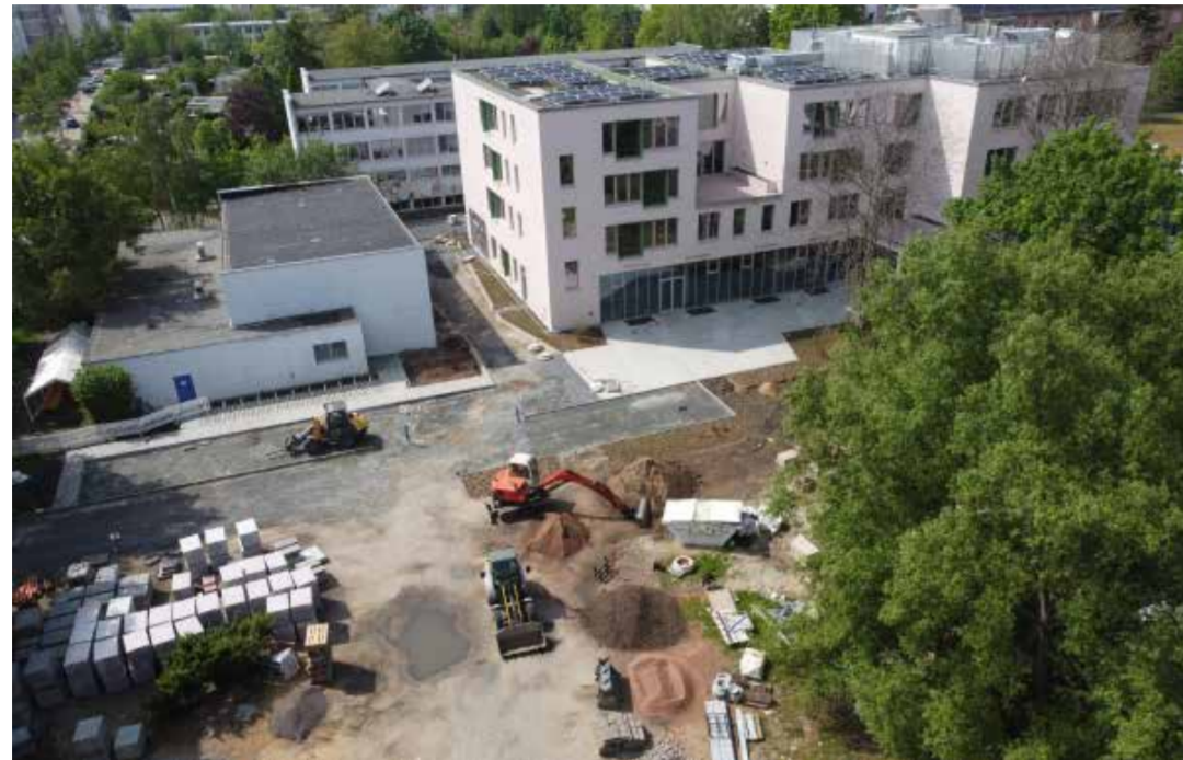
Neubau Freie Montessorischule Huckepack